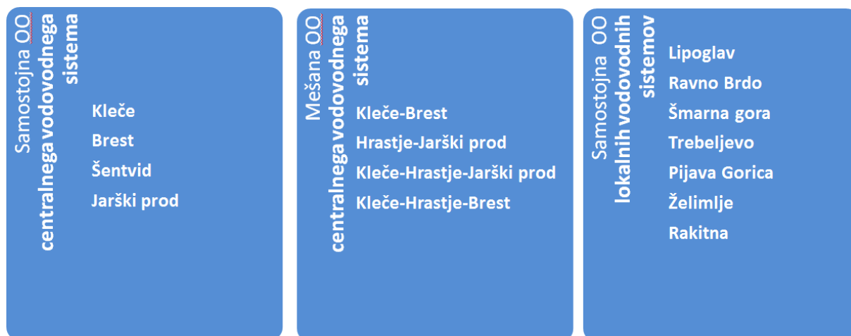
Slika 1. Seznam oskrbovalnih območij centralnega in lokalnih vodovodnih sistemov v upravljanju JP VOKA SNAGA.

Centralni vodovodni sistem mesta Ljubljana in okolice se oskrbuje iz dveh virov podzemne vode: iz Ljubljanskega polja in Ljubljanskega barja. Podzemna voda se črpa v petih vodarnah: Kleče, Hrastje, Jarški prod, Šentvid in Brest. Vodni vir Dolsko predstavlja rezervni vodni vir centralnemu vodovodnemu sistemu Ljubljana. Lokalni vodovodni sistemi (Lipoglav, Ravno Brdo, Šmarna gora, Trebeljevo, Pijava Gorica, Želimplje, Rakitna) se napajajo iz lastnih, lokalnih vodnih virov, kjer je vodni vir podzemna voda, zajeta v obliki vodnjakov, z izjemo lokalnega vodovodnega sistema Rakitna, kjer je vodni vir površinska voda. V centralnem sistemu se nekatera naselja s pitno vodo stalno oskrbujejo zgolj iz ene vodarne, druga pa se oskrbujejo iz dveh ali več vodarn, kar je odvisno od porabe vode in tlačnih razmer. Na centralnem vodovodnem sistemu obravnavamo osem oskrbovalnih območij, kot sledi: Kleče, Brest, Šentvid, Jarški prod, Kleče-Brest, Hrastje-Jarški prod, Kleče-Hrastje-Jarški prod, Kleče-Hrastje-Brest. Vsak lokalni vodovodni sistem predstavlja lastno oskrbovalno območje (slika 1, 3).